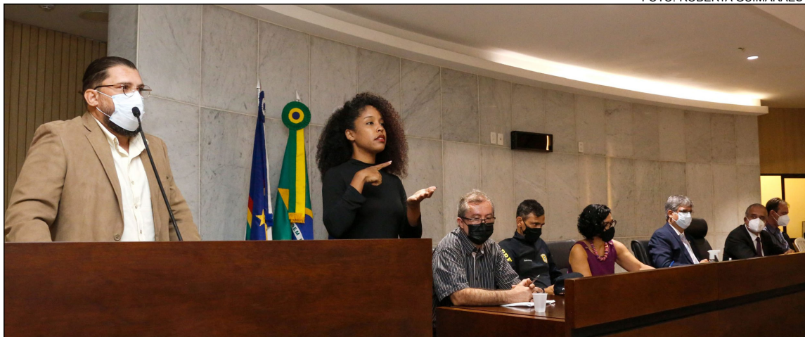
AUDIÊNCIA - Em março, encontro debateu lei que prevê manutenção semestral de veículos que fazem transporte escolar