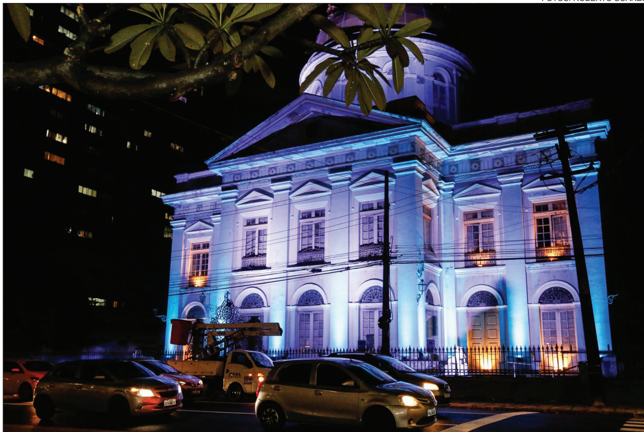
CULTURA - Espetáculo no Palácio Joaquim Nabuco envolve músicas natalinas adaptadas para ritmos pernambucanos