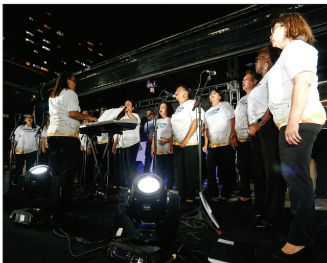
TRADIÇÃO – Inauguração contou com apresentações do Coral Vozes de Pernambuco e da Associação Coral Nossa Música

Apresentações prosseguem até a primeira semana de janeiro