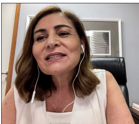
DISCUSSÃO - Comissão de Negócios Municipais acatou matérias tratando da cessão, renovação e doação de imóveis do patrimônio do Estado

As instituições receberão por mês, respectivamente: R$ 21 mil – durante 24 meses; R$ 15 mil, em 24 meses; R$ 10 mil, em 12 meses; e R$ 10 mil, ao longo de dez meses. Para receber os recursos, todas terão de firmar convênio com a Fundação do Patrimônio Histórico e Artístico de Pernambuco (Fundarpe). Caberá a esta última estipular as atribuições, as responsabilidades, as con-