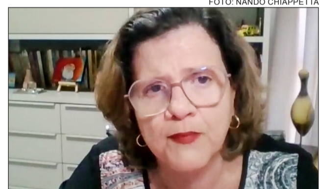
DEFASAGEM - “Analistas de gestão estão há oito anos sem aumento”

servidores que, além de qualificados, possuem compromisso social e querem fazer