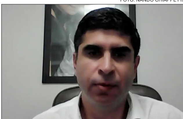
CONCLUSÃO - “Finalizamos o inquérito em 80 dias. Não entendo por que ainda não houve decisão da Justiça”

“Fui abordado por vários parentes das vítimas