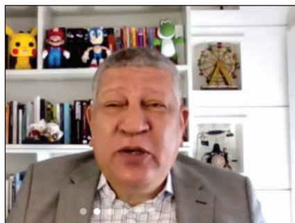
EMPENHO - Nascimento anunciou que duas outras alterações indicadas devem ser enviadas pelo Estado em fevereiro