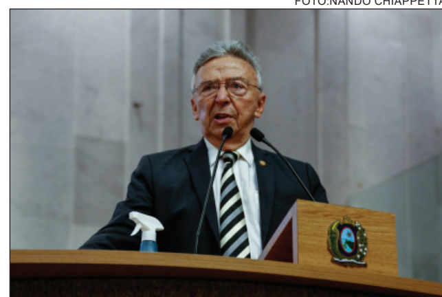
CONHECIMENTO - “É preciso levar à população os detalhes e a atuação competente das assessorias”

“É preciso levar à população os detalhes e a atuação competente das assessorias”