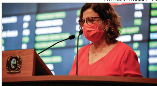
LUTA - “Doença tem tratamento e discriminação social também precisa ser tratada”

A petista citou dados do Programa Conjunto das Nações Unidas sobre HIV/Aids (Unaid) segundo os quais 64% das pessoas com a infecção já sofreram preconceito, 46% ouviram comentários negativos no ambiente social e 41% foram discriminadas pela própria família. “Além disso, um quarto delas sofreu assédio verbal, quase 20% perderam o emprego ou a fonte de renda, 17% foram excluídas de atividades sociais por serem soropositivas e 6% relata-