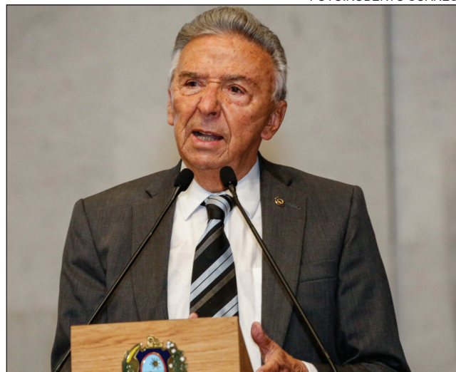
CAMINHO - “Mundo rico precisa dividir vacinas com mundo pobre”