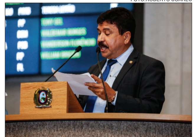
QUÓRUM - Requerimento dele foi rejeitado na Ordem do Dia