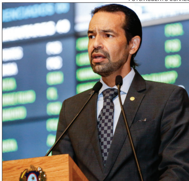
LEGISLATIVO - Deputado foi eleito para a Vice-Presidência da entidade