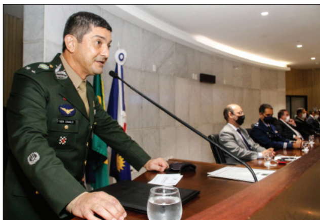
EXÉRCITO - General de brigada Danilo Alencar citou operações para levar água a mais de 500 municípios do Sertão