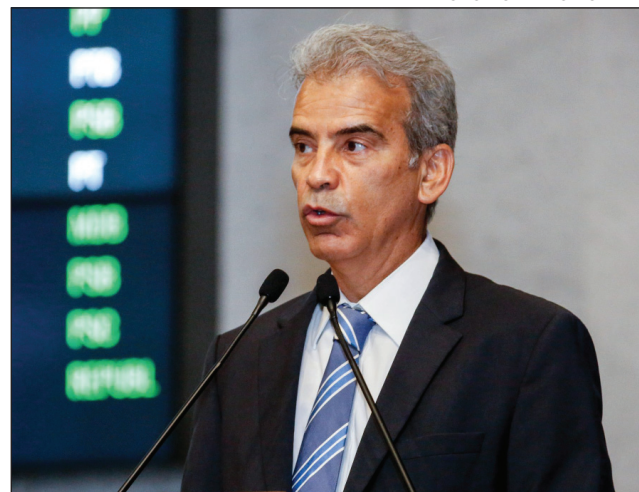
VÍDEO - “É lastimável que a conduta aconteça sob aplauso de professores”