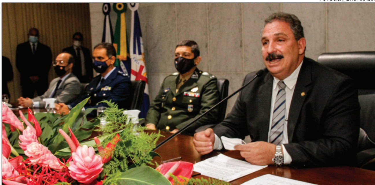
DISCURSO - Medeiros frisou relevância das Forças Armadas para a preservação da unidade e da soberania nacional

Comandante do II Comar, o brigadeiro do ar Cesar Faria Guimarães também agradeceu a homenagem dedicada à instituição, que completa 80 anos no próximo dia 8 de dezembro. “Em nossas asas, convido todos para mais oito décadas de missões cumpridas com o apoio da sociedade”, concluiu.