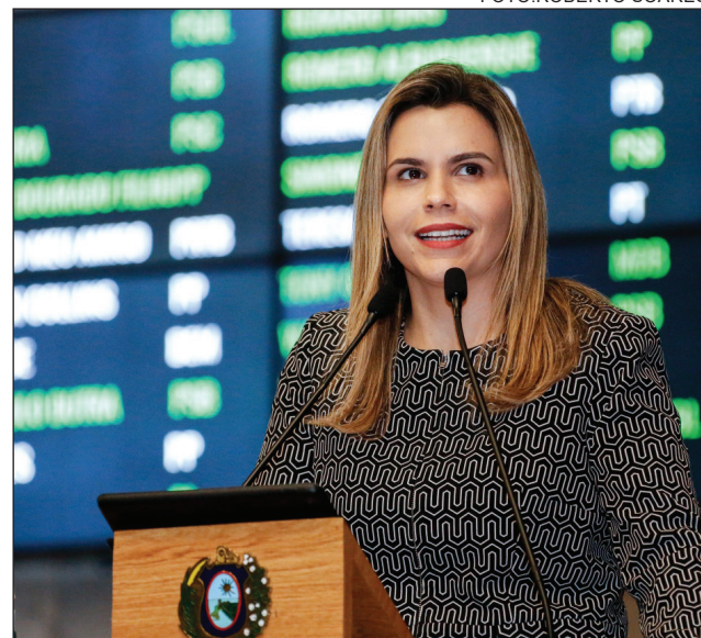
CELEBRAÇÃO - “É um encorajamento para continuarmos avançando com a propagação da verdade que liberta”