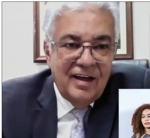
AUTOR - Antônio Moraes ressaltou que o projeto foi fruto de debates realizados pela Alepe com pequenos produtores rurais