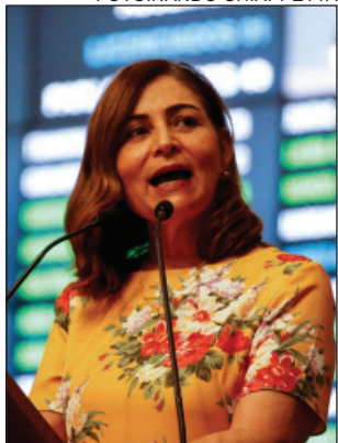
INVESTIMENTO - Benefício para turistas e população