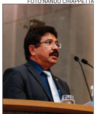
REQUERIMENTO – Deputado propôs Frente Parlamentar sobre o tema

A responsabilidade desses aumentos, segundo ele, seria da política federal que atrela o preço dos combustíveis ao dólar a fim de “garantir os ganhos dos acionistas da Petrobras”. “Não é verdade que a culpa é dos impostos. Os Estados se reuniram e aprovaram, no Confaz (Conselho Nacional de Política Fazendária), o congelamento do chamado preço médio ponderado