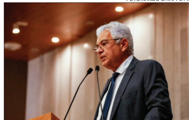
CARRO-PIPA – “Todos os rios estão secos”