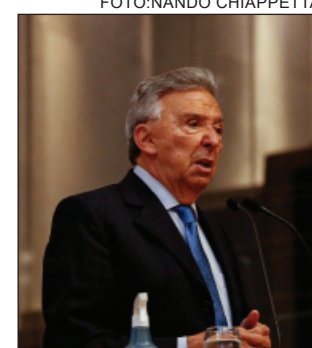
CARUARU CITY - “Parabenizo equipe técnica, jogadores e diretoria”

“Parabenizo equipe técnica, jogadores e diretoria pelo trabalho, mas, principalmente, pela coragem de se lançar no futebol profissional neste momento de tantas dificuldades no esporte”, registrou o pedetista, que também comemorou o acesso do Ibis Sport Club à