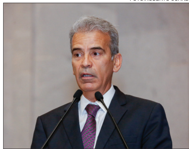
BIS IN IDEM - “Ninguém pode ser punido duas vezes pelo mesmo delito”

O parlamentar sugeriu que a matéria volte a ser analisada pela Comissão de Justiça, onde foi aprovada em 25 de outubro. Também defendeu a realização de uma audiência pública para tratar do tema no colegiado de Segurança Públi-