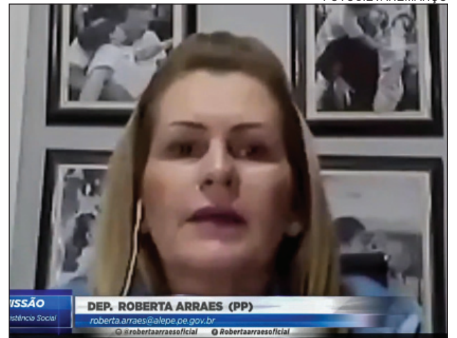
DIGITAL - Comissão de Saúde acatou projeto para incluir diretrizes sobre mídias sociais e jogos que possam levar à violência no Plano de Educação