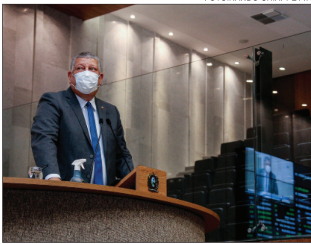
CONEXÃO - “Empresas prestadoras de serviço não cumprem com seus deveres”