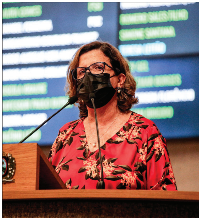
DIÁLOGO - “Movimento completou cem dias, sem perspectiva de solução”