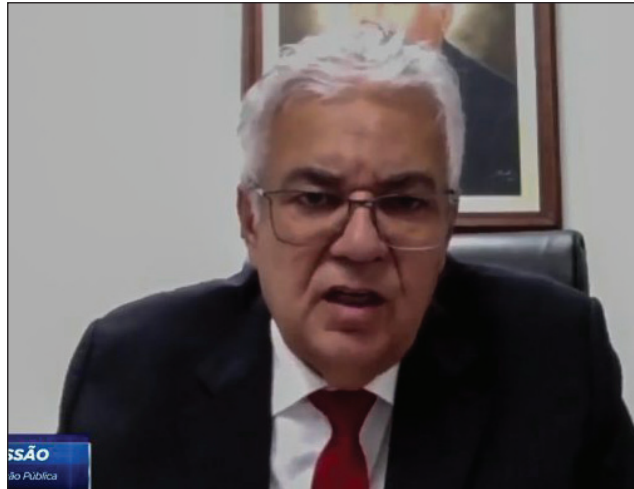
AVAL - A matéria também foi analisada pelo colegiado de Administração Pública, presidido por Antônio Moraes