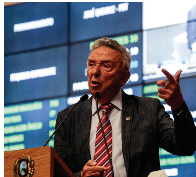
CONTRADIÇÃO - “Continuo sem entender como integrantes da Oposição apoiaram esse projeto, que tem clara finalidade eleitoreira”