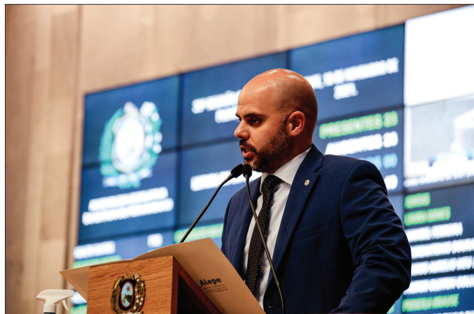
PANDEMIA - “Se estamos gastando mais e a população continua mal assistida, o erro é de administração”

Por fim, ele contou ter visitado o Hospital de Referência contra a Covid-19 em Boa Viagem (antigo Alfa), na Zona Sul do Recife. O deputado sugeriu que a estrutura temporária seja mantida pelo Governo do Estado: “Pode ser utilizada para a realização de cirurgias eletivas, desafiando outras unidades superlotadas”.