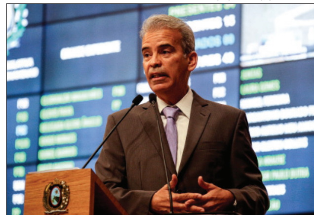
PROBLEMAS - “Empreendimentos não andam por causa da incompetência do Executivo e por indícios de mau uso do dinheiro público”