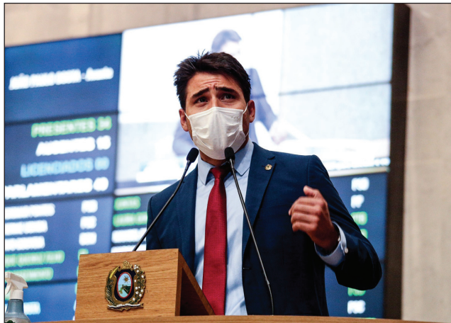
INICIATIVAS - Propostas buscam promover medidas de segurança sanitária para a população