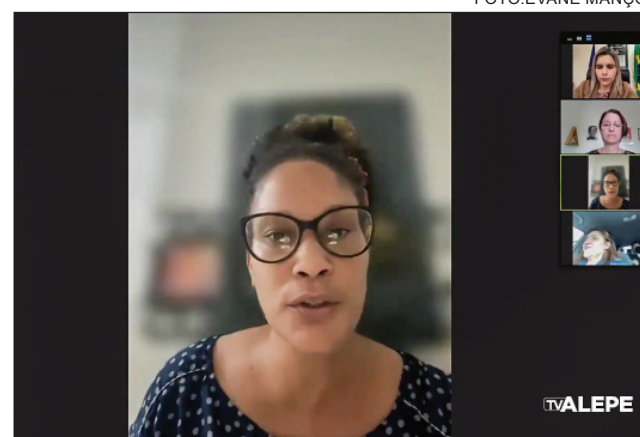
GESTÃO - “Há relatos de pareceres técnicos que foram desconsiderados pelos diretores, a fim de aprovar empreendimentos com graves impactos”

O mandato coletivo também manifestou solidariedade