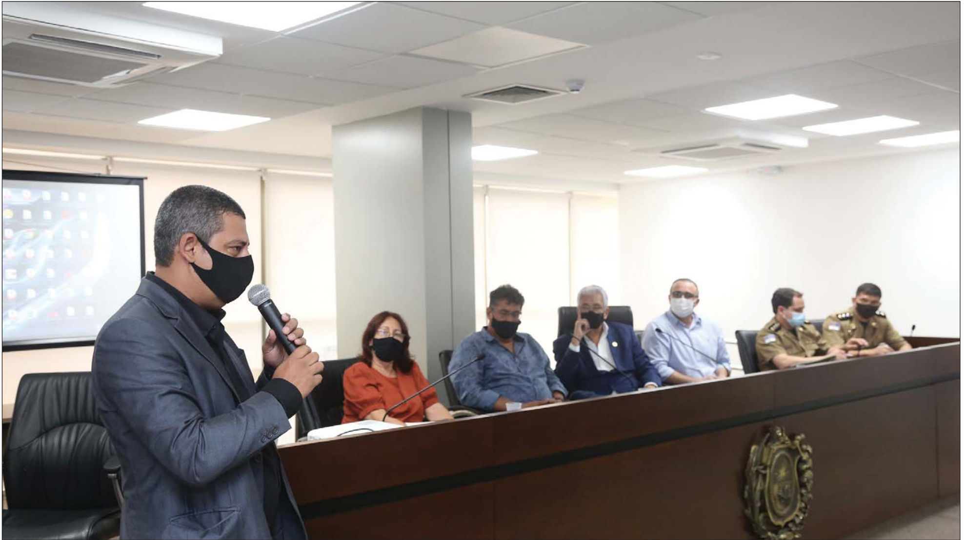
DISCUSSÃO - Colegiado de Administração Pública realizou encontro presencial na manhã de ontem, no auditório da Assembleia Legislativa