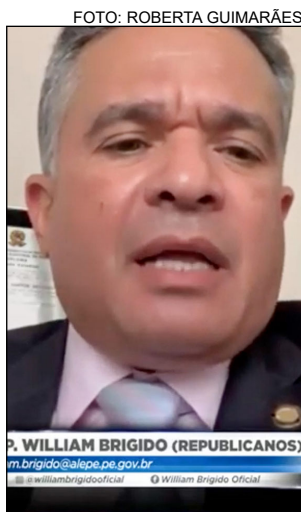
EDUCAÇÃO - Relatório ficou a cargo de Brigido

A versão atual da matéria estabelece que o benefício para as pessoas