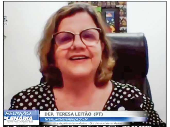
SITUAÇÃO - “Finanças melhoraram, mas o Poder Executivo ainda se nega a tratar com o funcionalismo”