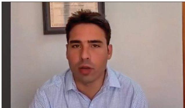
APOIO - “Proposta está sendo estudada pelo Governo do Estado”