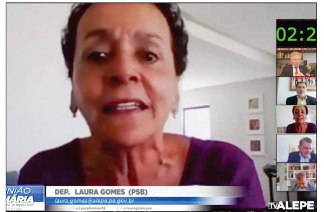
INDICAÇÃO - “Fico muito feliz com a medida, pois havia feito uma solicitação nesse sentido ao governador Paulo Câmara”