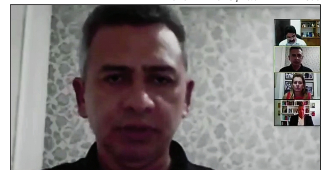
"Sabemos da ausência do Governo Federal na condução de programa"