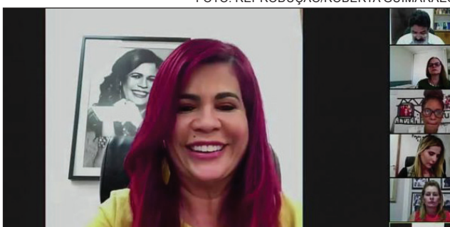
ELEITAS - Feira Nova, Glória do Goitá, Ipojuca e Jaboatão dos Guararapes foram as cidades ganhadoras, informou Gleide Ângelo

Entre os critérios analisados para a concessão do prêmio estão as políticas de atenção integral à saúde feminina e o enfrentamento da violência contra