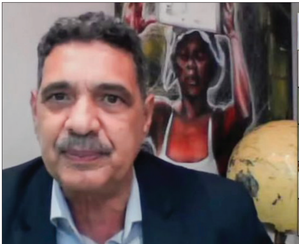
LINHA DE FRENTE - “Trabalhadores tiveram papel central para salvar vidas durante toda a crise da pandemia”