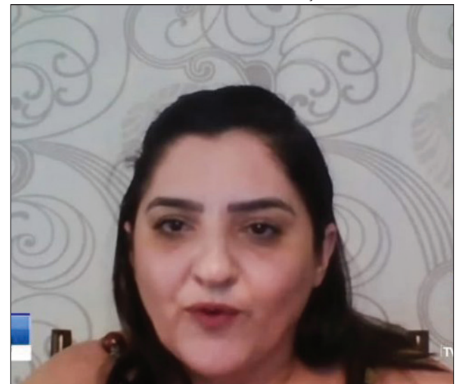
INICIATIVA - “Projeto de Lei 2188 quer sanar problema de saúde pública”