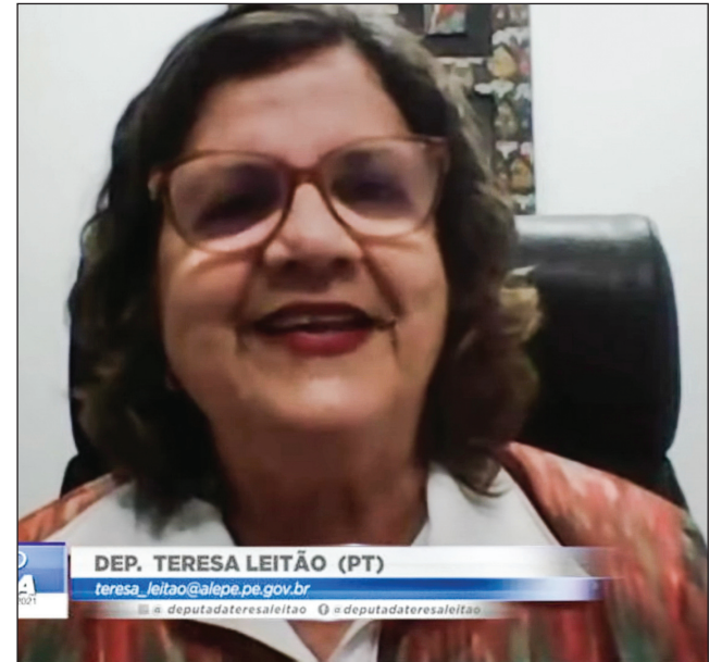
PLEITO - “Categoria defende que a volta ao trabalho presencial só deve ocorrer depois da imunização”