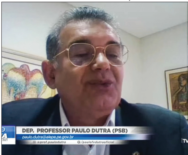
CARUARU - “Com esforço e dedicação de profissionais e gestores, jovens podem sonhar e ser protagonistas de suas vidas”