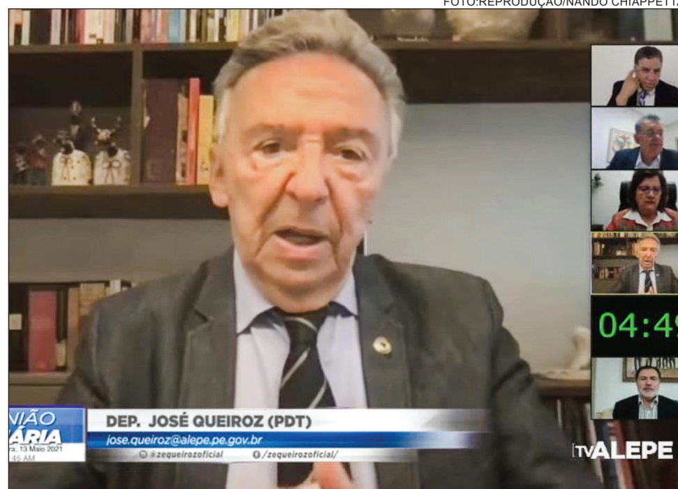
VACINA - Pedetista lamentou os mais de 428 mil mortos pela Covid-19 no País: “Quantas vidas poderíamos ter salvo?”