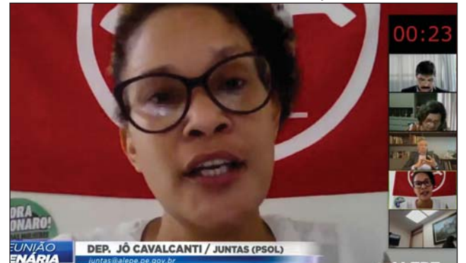
LEVANTAMENTO - Para deputada, Governo teria condições de pagar seis parcelas mensais de R$ 350 a 70 mil famílias em situação de extrema pobreza