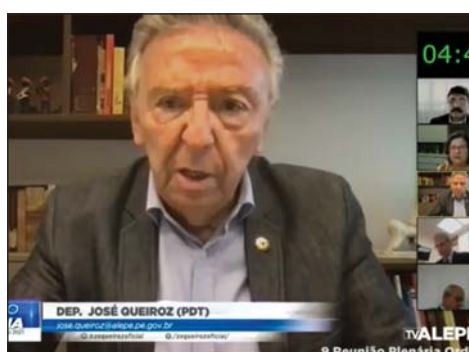
CRÍTICA - Pedetista classificou reunião recente como "enganação"