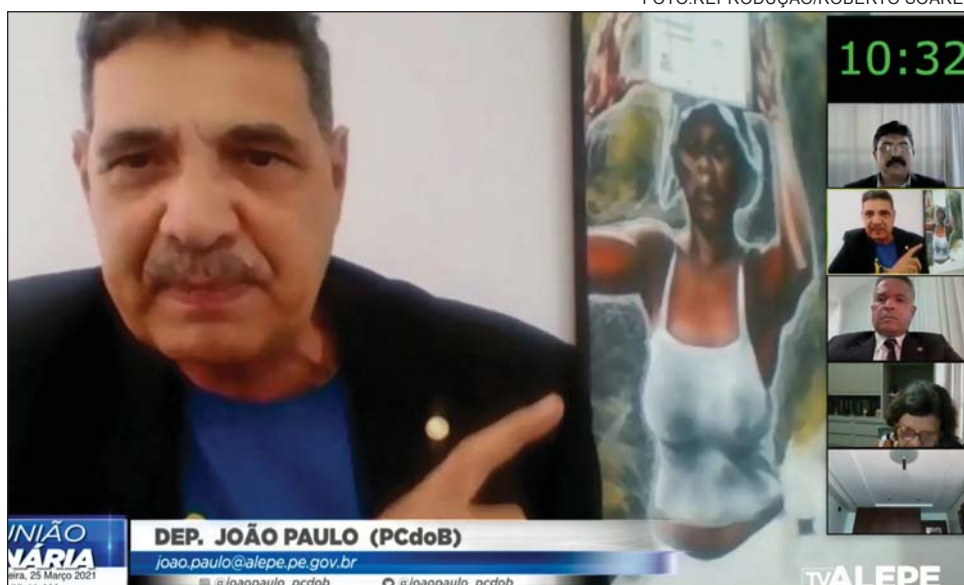
TRAJETÓRIA - “Sempre estive à frente das grandes lutas contra a exploração e a violência, e ao lado da justiça social e da democracia”

“Também estivemos presentes na jornada vitoriosa que levou Luiz Inácio Lula da Silva à Presidência da República. E continuamos firmes contra o des-governo de Jair Bolsonaro, que é aliado do coronavírus e um genocida como não se vê desde a 2ª Grande Guerra do século 20”, completou. “Além disso, nosso partido é defensor da soberania nacional, contra o