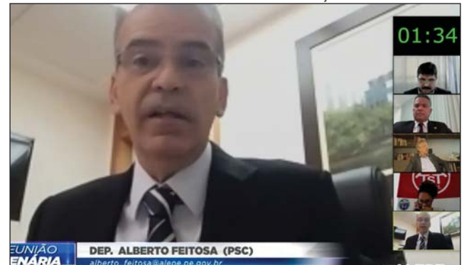
ANÁLISE - "Jair Bolsonaro se abriu ao diálogo"

plementaram o que chamou de "tratamento preventivo e precoce" contra a doença. Ele apontou o problema da aglomeração no transporte coletivo,