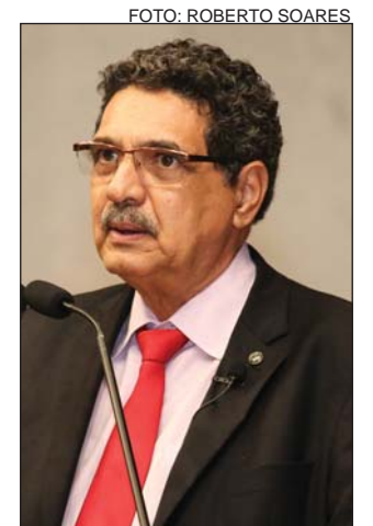
FOCO - Mudanças