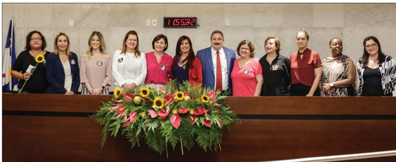
ENCONTRO - A reunião integrou o “Março de Luta”, mês dedicado à defesa dos direitos da mulher

resgatou histórias como a de Brites de Albuquerque, primeira e única governadora de Pernambuco, no século 16. Falou ainda da princesa congolosa Aqualtune, que ajudou a comandar o Quilombo dos Palmares, das heroínas de Tejuçupapo, de Bárbara de Alencar (figura importante da Revolução