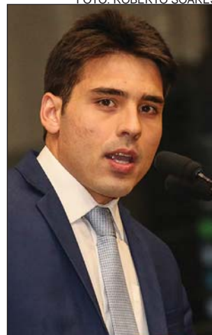
ESTREIA - Prioridades