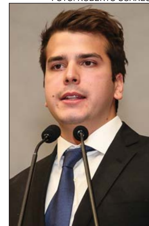
OSS - “Caixa preta”

parência com informações sobre as pessoas físicas que recebem recursos de OSS poderia ter ajudado a identificar fraudes como a descoberta no Hospital Miguel Arraes. “O que importa agora é que o Tribunal de Contas do Estado (TCE-PE) determinou o prazo para atendimento das recomendações, e o cumprimento delas será a prova dos nove para o Governo”, declarou.