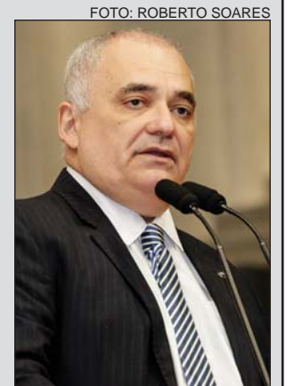
VISITA - Unidades de saúde

“Como deputados, temos a obrigação de visitar esses hospitais para acompanhar a situação. Apesar dos valores que o