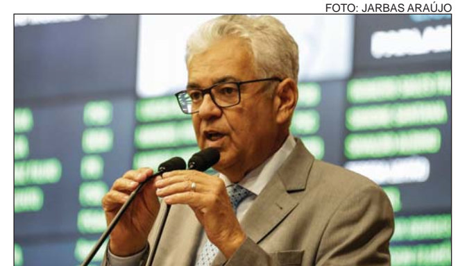
OBJETIVO - Evitar tragédias como a de Brumadinho

nária das Barragens, após o rompimento da barragem de rejeitos da Samarco, que destruiu o povoado de Bento Rodrigues, matou 19 pessoas e poluiu o Rio Doce com metais pesados em novembro de 2015. “Infelizmente, em Minas, o lobby das mineradoras foi vencedor, e a gente teve em Brumadinho perda de vidas humanas e destruição ambiental”, lamentou.