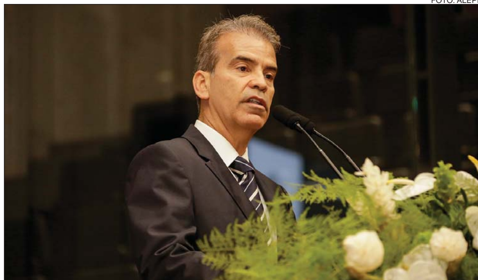
PRESTÍGIO - Cerimônia contou com a presença de deputados, servidores e autoridades