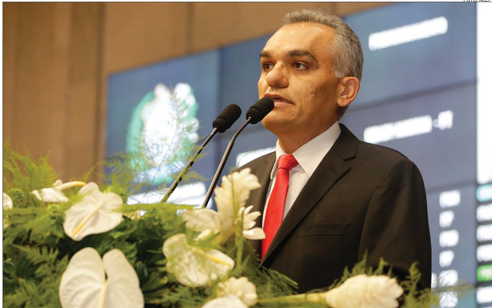
ANÁLISE - Deputado frisou empenho do ex-presidente Lula em tirar do papel o projeto, que vem sendo discutido desde o período imperial