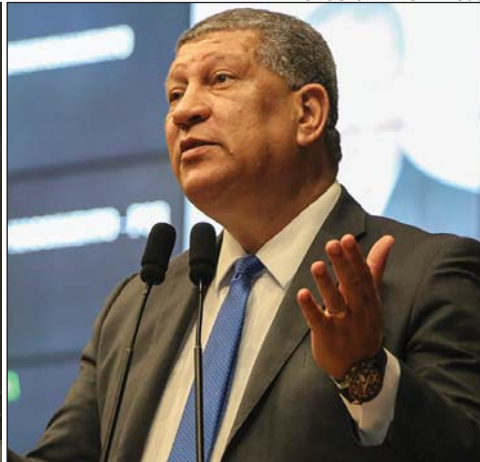
ISALTINO - Benefícios para quem mais precisa

de ser um “tarifaço apresentado ao povo de Pernambuco depois da eleição”. Ele ponderou que a ideia pode prejudicar o comércio informal, porque exige que as pessoas apresentem as notas fiscais de compras mensais de produtos da cesta básica para receber a parcela do benefício.