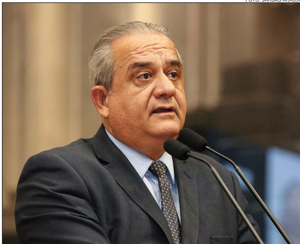
PREOCUPAÇÃO - “Só há um navio em fabricação no polo”

“Vivemos uma situação de muita apreensão no setor. Só há um navio em fabricação no polo, e os trabalhadores que participaram das primeiras etapas da construção vêm sendo demitidos por não terem mais serventia nas seguintes”, lamentou o socialista. “Foi feito um grande investimento na formação