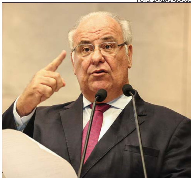
MANIFESTAÇÃO - Norma foi sancionada na semana passada

bens imateriais já possuem, como o próprio frevo, que conta com um espaço público de promoção cultural”, afirmou, citando o Paço do Frevo, espaço cultural instalado no Recife.