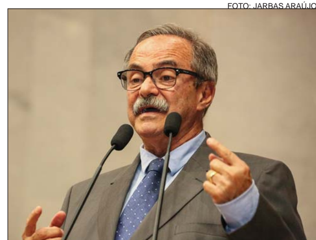
MANUAL - Gestor sugeriu projetos que podem ser beneficiados

Os parlamentares têm até 14 de novembro para apresentar emendas individuais ao Projeto da Lei Orçamentária Anual, em tramitação na Casa. Por meio desse instrumento, são reservadas partes das receitas estaduais para serem aplicadas em políticas públicas ou repassadas a entidades da sociedade civil em 2019.