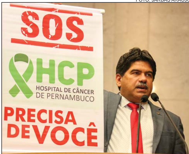
JADEVAL - “Precisamos ajudar o Hospital de Câncer”

medicações coadjuvantes dos tratamentos de câncer de mama e de próstata, que estariam em falta nas farmácias especiais. O assunto já havia sido abordado em abril. “Quatro ou cinco meses podem ser a diferença entre a vida e a morte desses pacientes”, concluiu.