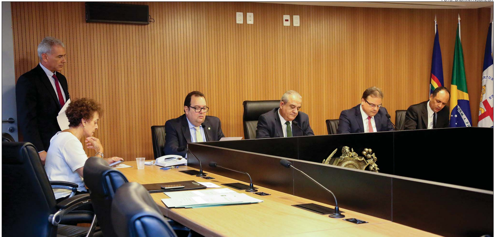
ARTICULAÇÃO - Colegiado defende que Governo Federal dê prioridade à indústria nacional na contratação de navios da Petrobras e da Marinha