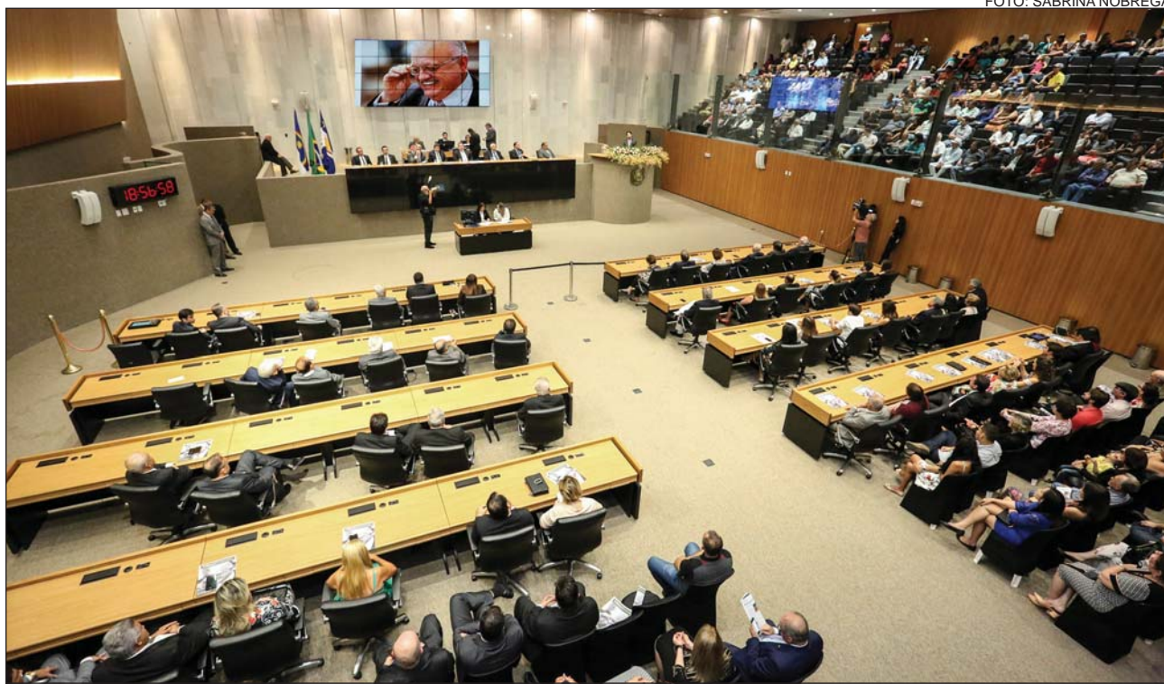
HOMENAGEM - Cerimônia reuniu parentes, amigos e autoridades, que relembrou a vida e a atividade política do parlamentar