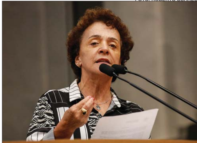
PESAR - “Cadengue foi um dos maiores nomes do teatro nacional”