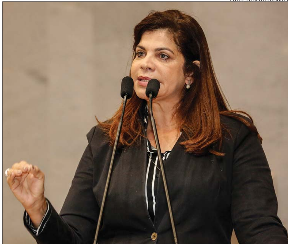
CRISE - “Faltam remédios também para pessoas com doenças raras e com Mal de Parkinson”