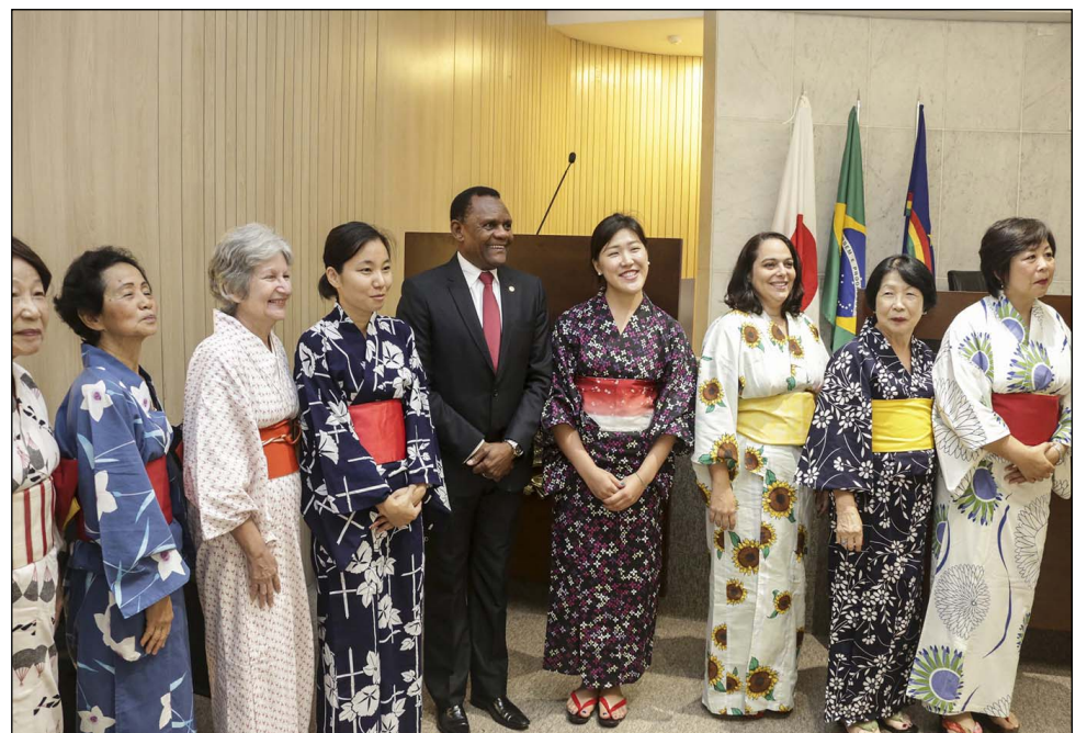
HOMENAGEM - Em junho, Reunião Solene celebrou o Dia Nacional da Imigração Japonesa

Além disso, o colegiado realizou reuniões ordinárias e extraordinárias ao longo do primeiro semestre, tendo aprovado três proposições. Um dos projetos de lei acatados determina a inclusão da Regata Internacional Recife-Fernando de Noronha (Refeno) no Calendário Oficial de Eventos do Estado.