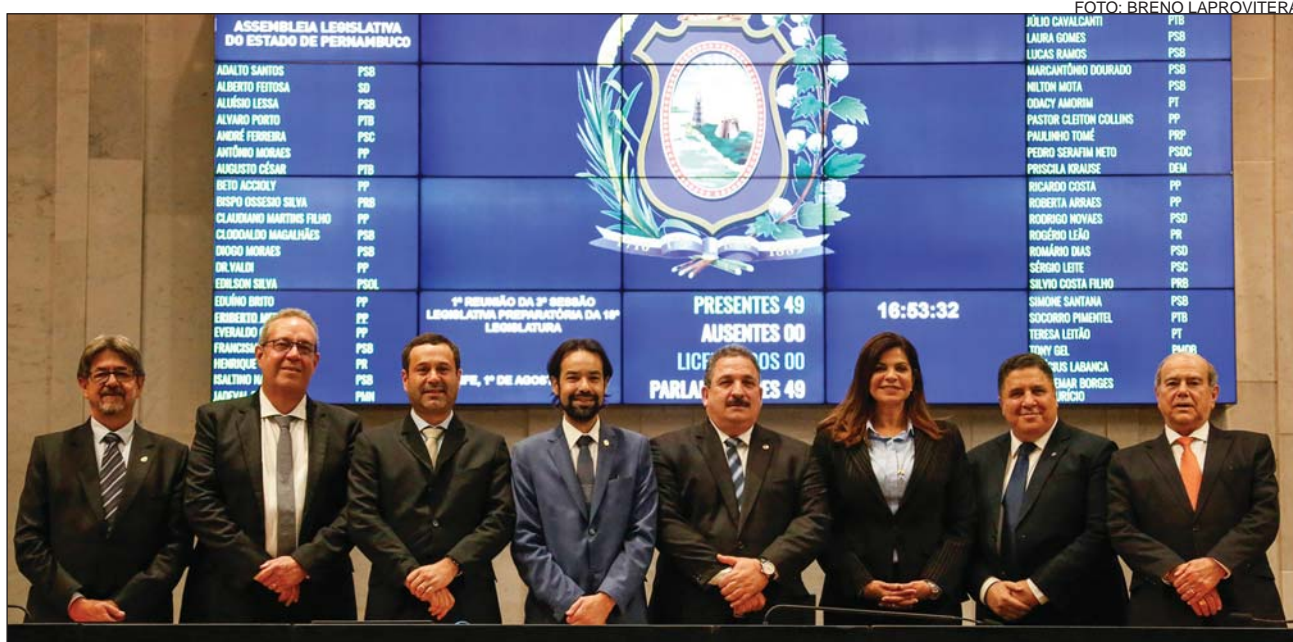
COMPOSIÇÃO - Os parlamentares foram empossados após a eleição e, juntamente aos demais membros da Mesa, exercerão as funções até 31 de janeiro de 2019