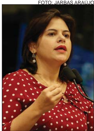
NORMA - Adequação

A lei estabelece o prazo de 24 meses para que as empresas e sociedades de economia mista promovam as adaptações necessárias