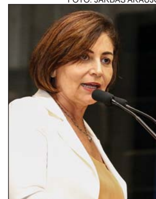
APOIO - Carta aberta

A falta de recursos - dinheiro, apoio político e tem-