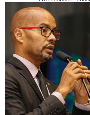
PROTESTO - Riscos à saúde

Para o psolista, a votação contrariou uma luta encabeçada por ambientalistas, Ministério Público, Ministério da Saúde e Instituto Nacional do Câncer (Inca). “Todos eles estão contra o projeto. Nós temos uma legislação moderna, que precisa ser rígida porque um agrotóxico é um produto químico que pode ser, inclusive, veneno. Agora a proposta foi liberada para ser votada no Plenário, colocando a questão do registro provisório [antes da aprovação pelos órgãos