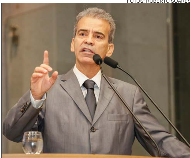
OPINIÃO - “Capacidade de diálogo e perfil conciliatório”

“Na sexta passada, tive a grata satisfação de dialogar com Aldo Rebelo e fiquei admirado com a sua militância política e o reconhecimento que tem entre as Forças Armadas”, declarou o parlamentar. O deputado ressaltou, ainda, o início da vida política de Rebelo como presidente da União