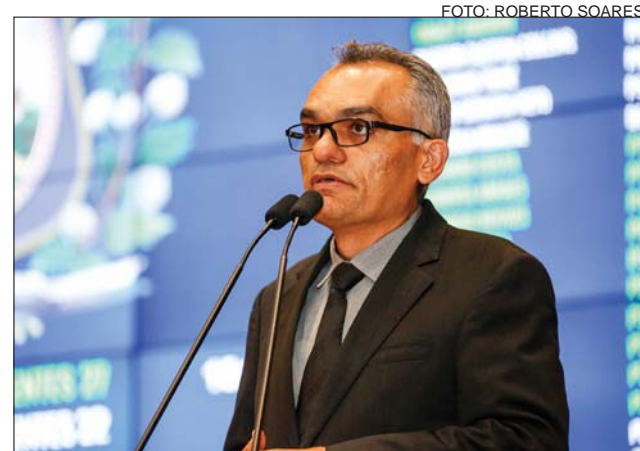
IMPASSE - Reintegração de posse no Projeto Pontal

Amorim comentou, ainda, a morte de uma menina de 12 anos, em Petrolina, no último fim de semana. De acordo com o deputado, a Polícia Civil investiga a possibilidade de suicídio. “Quero me solidarizar com os pais e pedir ao Governo do Estado que esclareça o caso. Precisamos estar atentos ao crescimento dos índi-