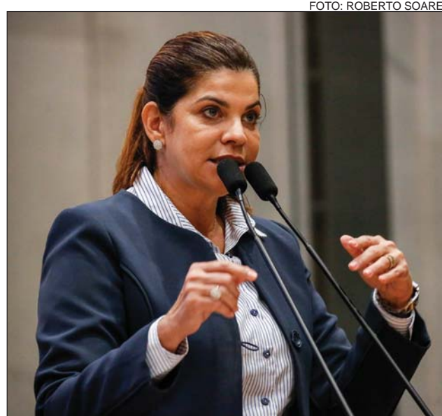
TRIBUNA - “Todos nós iremos pagar a conta”

Socorro Pimentel também expôs o resultado da projeção feita por pesquisadores brasileiros e ingleses, publicada em 22 de maio no “PLOS Medicine”. Segundo o trabalho científico, se programas de proteção social