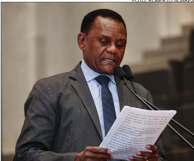
REFLEXÃO - A violência contra crianças é um transtorno grave