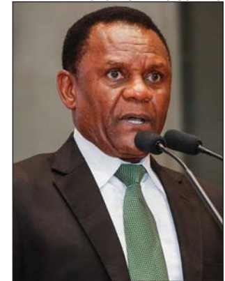
ALERTA - Alta incidência

assustadores, eles infelizmente não mostram a realidade da violência, já que muitas vítimas e seus familiares deixam de denunciar por medo e vergonha”, afirmou.