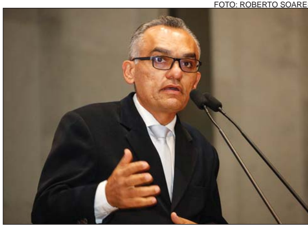
QUEIXA - “Pagamos um dos combustíveis mais caros do mundo.”

O parlamentar salientou, ainda, que o presidente da Câmara dos Deputados, Rodrigo Maia, anunciou que haverá um debate no próximo dia