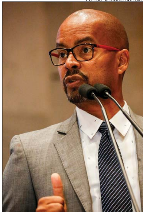
COSTA FILHO - Cortes em políticas essenciais EDILSON - Gastos com publicidade em alta