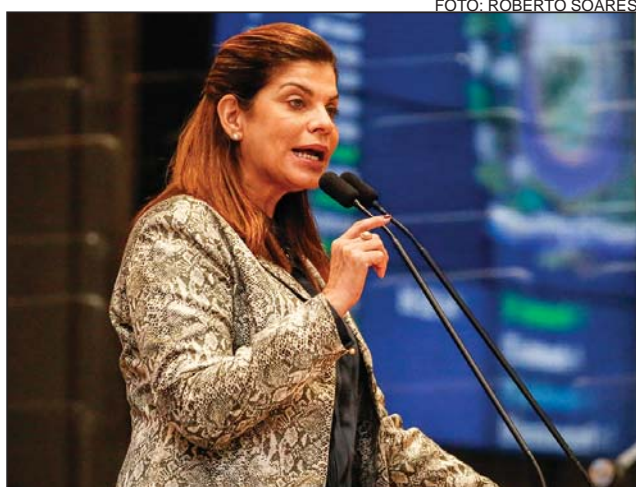
AÇÃO - Proposta foi apresentada pelo Ministério da Saúde