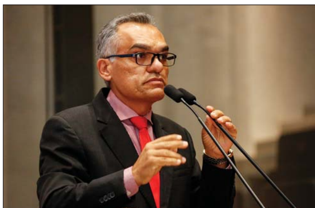
AMORIM - Respeito à Constituição

“O PT e os advogados de defesa de Lula não estão pedindo privilégios, mas defendendo o respeito à Constituição”, disse Amorim. Para o parlamen-