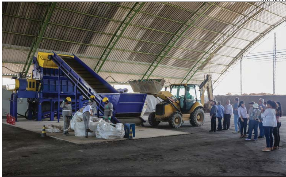
DESCARTE - Empresa pretende iniciar atividades de geração de energia por meio da queima de biogás

O CTR-PE, criado em abril de 2008, foi pioneiro no Nordeste no tratamento de resíduos considerados perigosos. Os chamados “Classe 01” são compostos por produtos inflamáveis, corrosivos, reativos ou tóxicos, como pi-