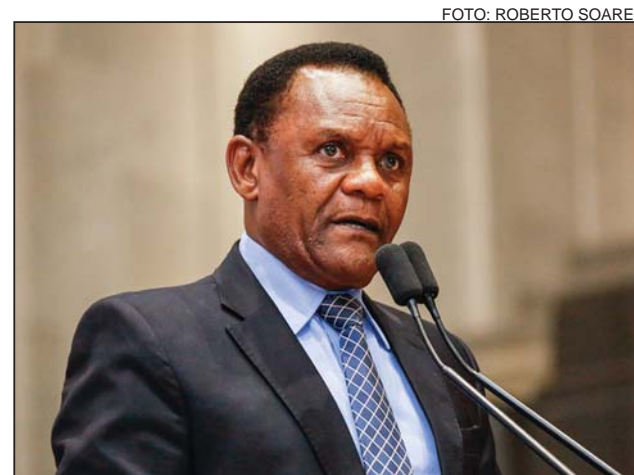
TRIBUNA - “O doutor King se tornou um exemplo a ser seguido”

“Muito se avançou desde a época de King, mas as questões levantadas por ele continuam atuais. Vimos agora há pouco o caso da vereadora Marielle Franco, que também foi assassinada por aqueles que não suportam o protagonismo da população