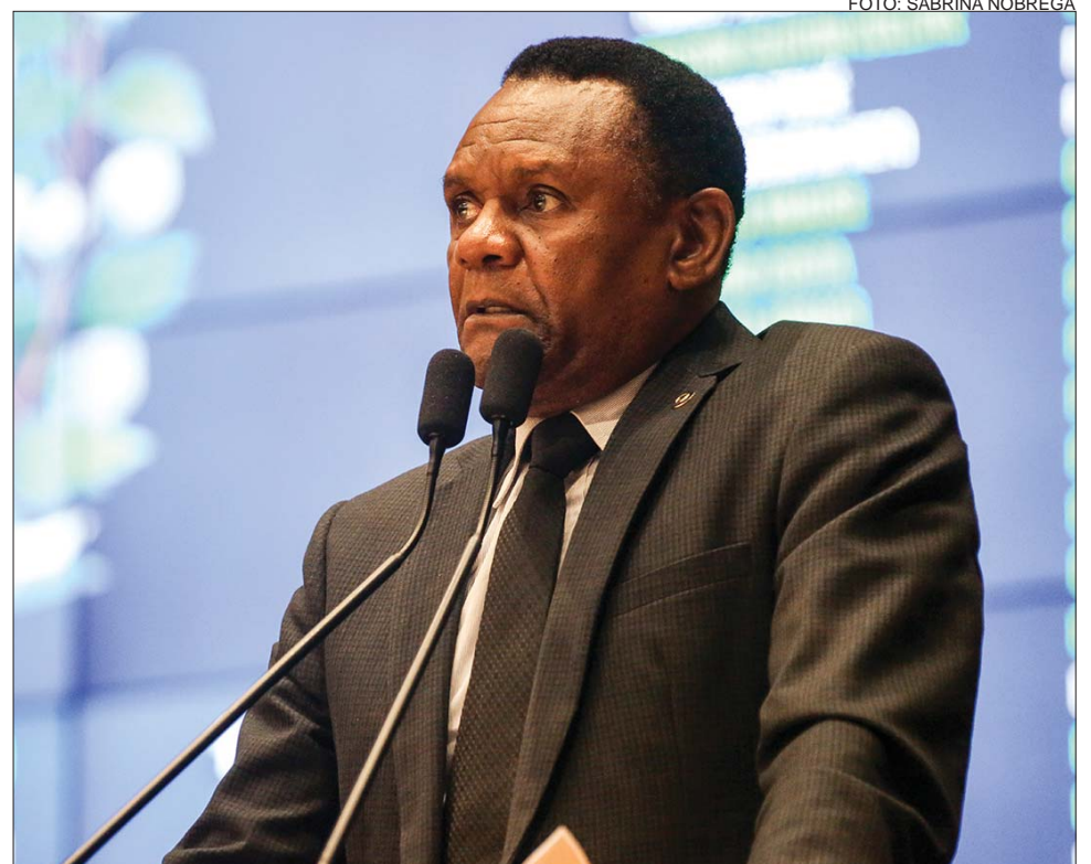
AÇÃO - Conselho Superior de Transporte Metropolitano autorizou a medida