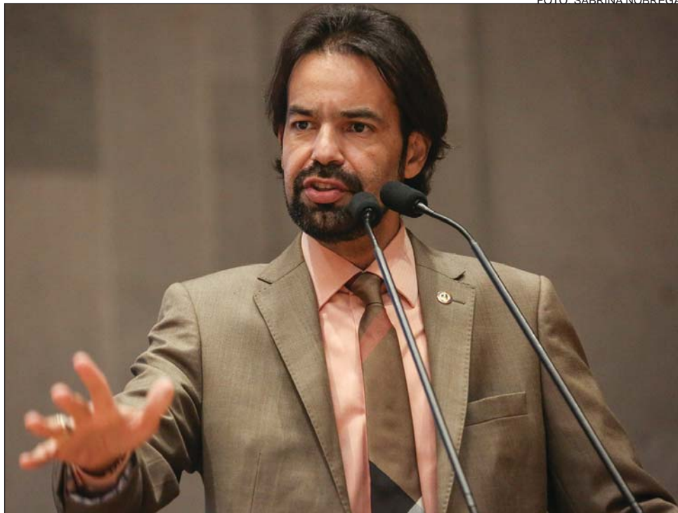
FACILIDADE - "Pavimentação de 30 quilômetros da Rodovia PE-310 irá encurtar distâncias"

Segundo o parlamentar, medida deve dar prioridade à obra