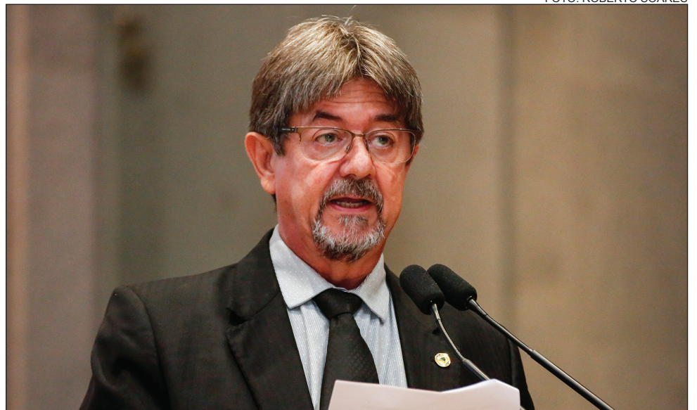
ESPERA - Segundo o deputado, dono da unidade médica aguarda o registro há dois anos