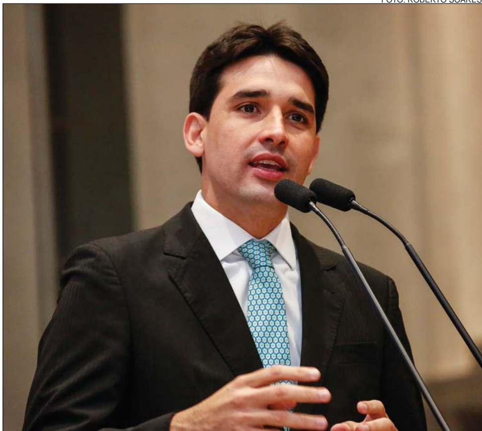
COBRANÇA - "Paulo Câmara precisa cumprir promessa de dobrar remuneração dos educadores"

Governador estabeleceu em R$ 5.750 o salário inicial dos docentes