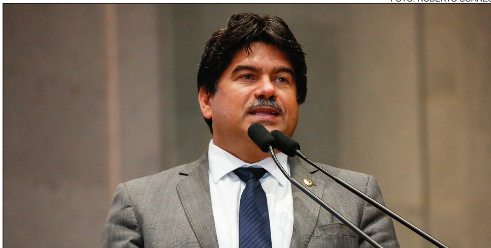
MUDANÇA - Deputado assumirá vice-presidência do Diretório Estadual da legenda