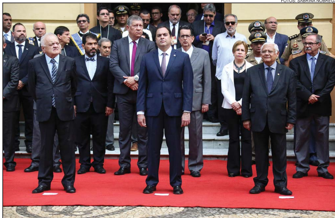
SOLENIIDADE - Cerimônia, marcada por homenagens aos mártires do acontecimento histórico, desfile cívico-militar e entrega de medalhas condecorativas, reuniu autoridades do Estado no Palácio do Campo das Princesas

Por sua vez, o governador Paulo Câmara ressaltou que o movimento deixou como legado os valores de liberdade e de justiça social para o povo pernambucano. “Os ideais da revolução estão muito atuais. Ela representa a liberdade, a justiça e a luta de muitos per-