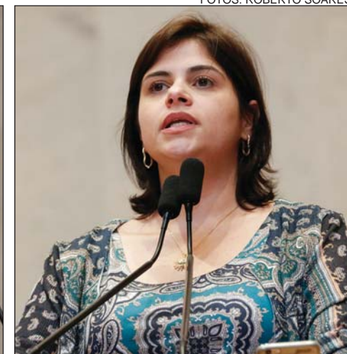
PRISCILA - “Presidente foi exonerado a pedido”