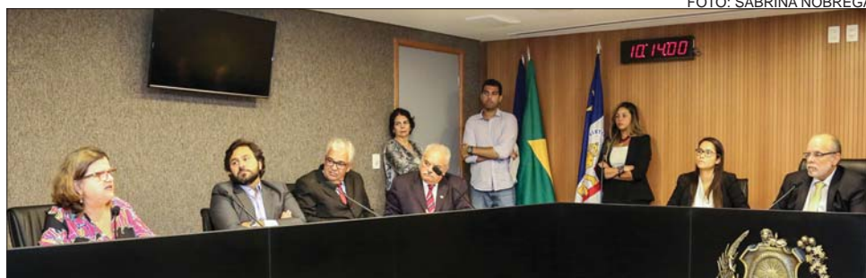
PRORROGAÇÃO - Problemas técnicos no sistema de parcelamento justificaram o adiamento

“Havia um grande estoque de escrituras pendentes nos cartórios por conta desse imposto e, por isso, o prazo concedido pelo Governo não foi suficiente”, acrescentou