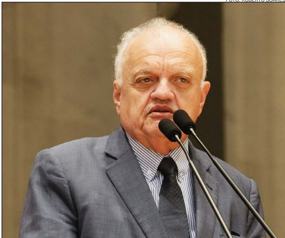
UCHOA - "Encerramos 2017 com a sensação de dever cumprido e uma lista de realizações"