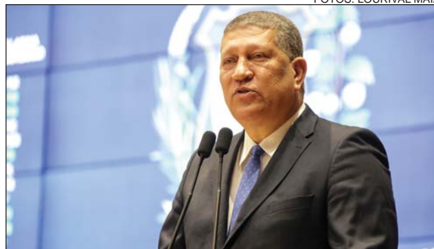
NASCIMENTO - Superação das adversidades

Outro problema levantado foi o número de obras inacabadas no Estado. “Segundo o Tribunal de Contas, temos mais de 1,5 mil obras