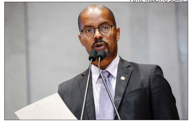
“Há fortes suspeitas de irregularidades”