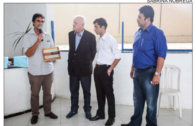
EVENTO - Ação ocorreu durante a 76ª Exposição de Animais

Ainda na categoria queijo coalho, ficou com o segundo