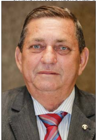
AUTOR - Everaldo Cabral propôs a matéria

forma deficiente, ou seja, fabrica pouco ou nada da substância”, explica a médica endocrinologista Geísa Macedo, membro do Instituto Brasileiro de Diabetes (Ibradi).