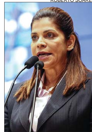
SOCORRO - Tratamentos

dias a partir do diagnóstico. Também enfatizou que a mortalidade por câncer de mama é até 11 vezes superior nas áreas mais pobres, em comparação com as regiões mais ricas. “Hoje, de acordo com a Sociedade Brasileira de Mastologia, há mamógrafos suficientes no País. No entanto, eles são mal distribuídos. A maioria está nas grandes cidades e capitais, deixando boa parte da população do Interior e pequenas cidades impossi-