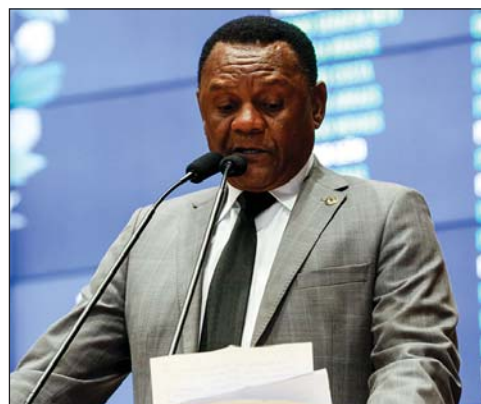
OSSESIO - “Segmento cresce rapidamente”

O republicano alertou para as estimativas do Instituto Brasileiro de Geografia e Estatística (IBGE): em 2050, 66,5 milhões de