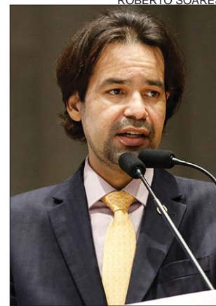
MORAES - 60 mil casos/ano

Socorro Pimentel registrou que Pernambuco é o Estado com a maior taxa de incidência da doença no Nordeste, com 53,84 novos casos para cada grupo de 100 mil mulheres. Ela apontou o descumprimento da Lei federal Nº 12.732/2012, que garante ao paciente com tumor maligno o direito ao primeiro tratamento no Sistema Único de Saúde (SUS) em até 60