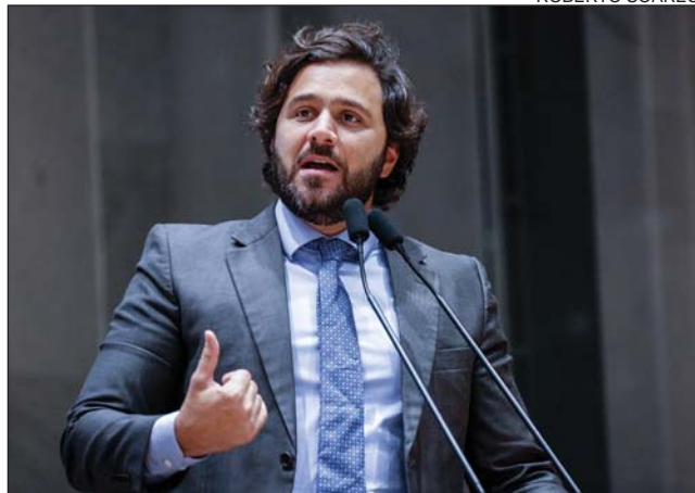
CONTROLE - Mecanismos vão assegurar obrigações trabalhistas