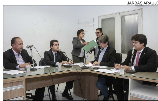
INICIATIVA - Unidade será construída pelo Governo do Estado

PACTO PELA VIDA - Durante a reunião, a Comissão de Administração também aprovou a realização de audiência pública sobre o Pacto