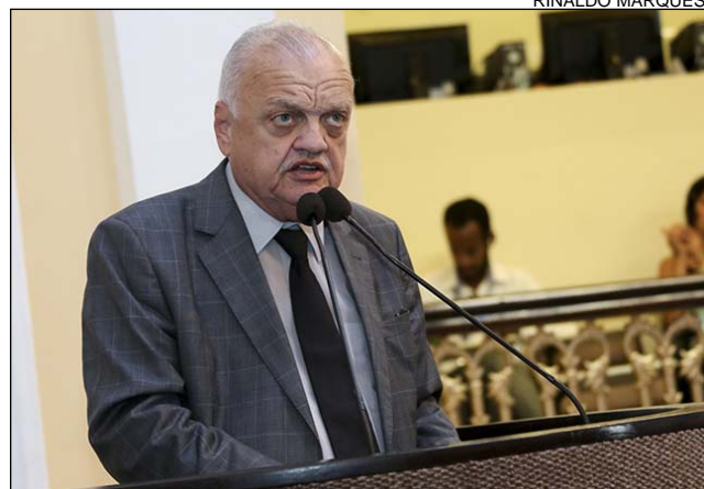
DOAÇÕES - Sede do Legislativo terá pontos de coleta