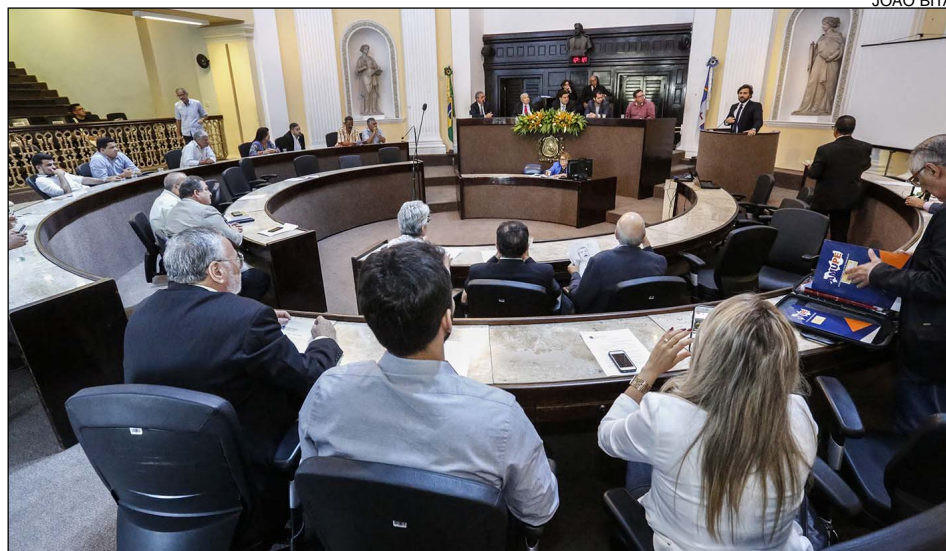
DEBATE - Segundo proposta, gestores deverão apresentar relatórios contábeis