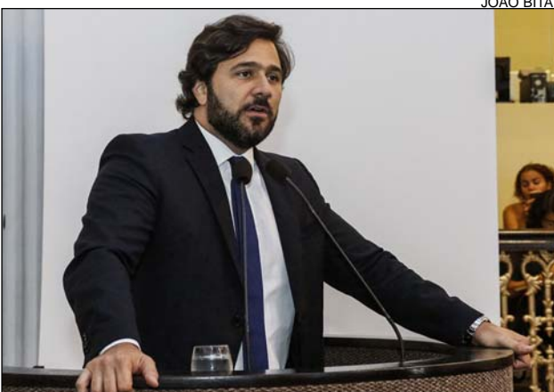
REDUÇÃO - Repasse caiu de R$ 75 milhões para R$ 19 milhões

Novaes afirmou ainda que, na última quarta (17), entrou em contato com o ministro Fernando Bezerra Filho, de Minas e Energia, para que interceda no caso junto ao Ministério da Integração Nacional: “Espero que a Codevasf traga para si a responsabilidade sobre o projeto e que o ministro da Integração Nacional tome medidas urgentes no sentido de normalizar o financiamento dessa iniciativa”, ressaltou.