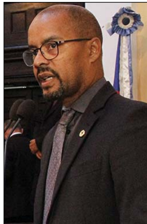
SILVA - “Inquérito”

Segundo o parlamentar, o Governo agiu para afastar os policiais de suas funções e “prestou toda a assistência médica e hospitalar possível ao paciente”. “Por determinação do governador Paulo Câmara, a Procuradoria Geral do Estado também procurou a família do rapaz para tratar de uma reparação”, salientou.