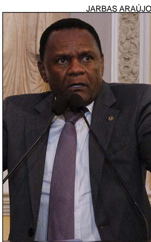
ACÇÃO - Voto de Protesto