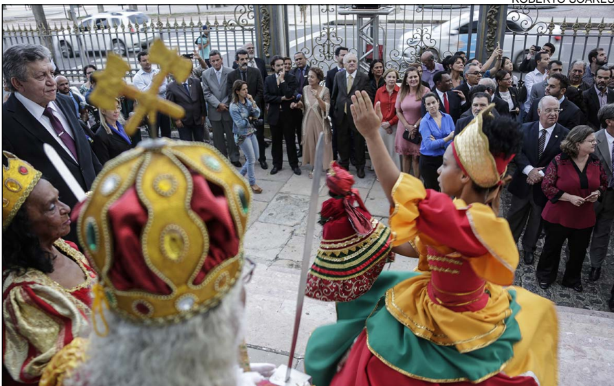
Maracatu Nação Camaleão se apresentou para deputados e convidados