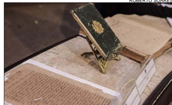
Primeiro Regimento Interno, de 1835, e as Atas da Sessão Legislativa de 1917 foram expostos