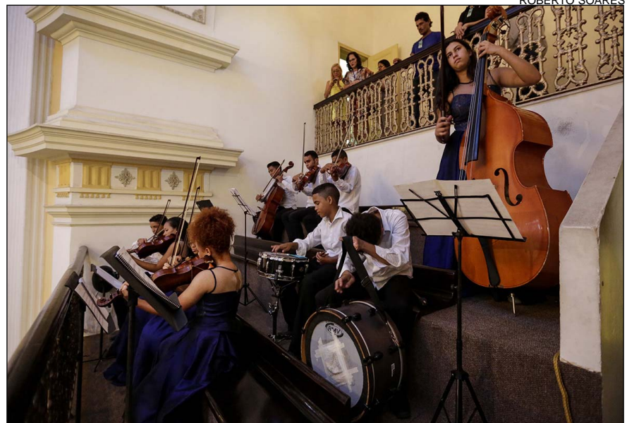
Orquestra Criança Cidadã tocou hinos de Pernambuco e do Brasil