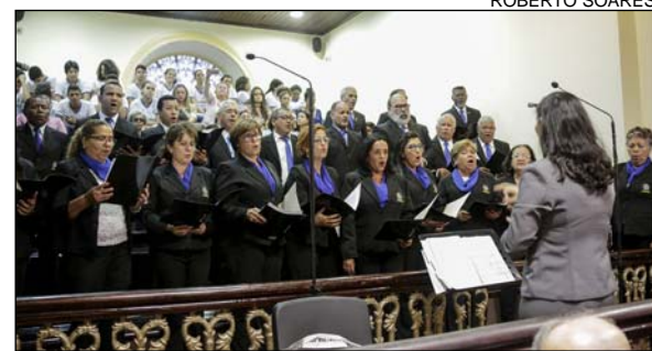
Coral Vozes de Pernambuco, formado por servidores da Assembleia, entoou canções durante a cerimônia