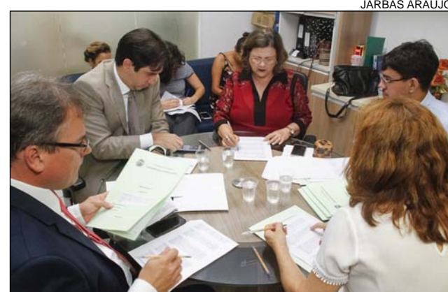
PAUTA - Implantação do piso nacional do magistério