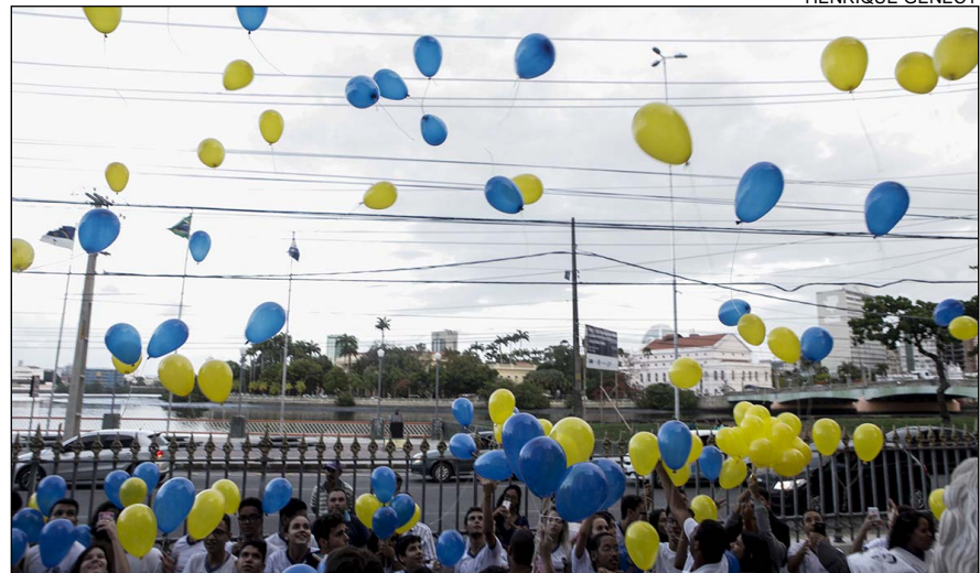
Estudantes do Ginásio Pernambucano soltaram balões de látex biodegradáveis