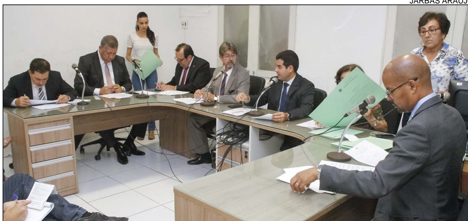
MUDANÇA - Entidades poderão adquirir energia de geradoras que participam do programa

Atualmente, órgãos estaduais compõem o ambiente de contratação regulada, o chamado mercado cativo, em que os consumidores adquirem energia das concessionárias e pagam faturas mensais com tarifas fixadas pelo Governo Federal. O projeto