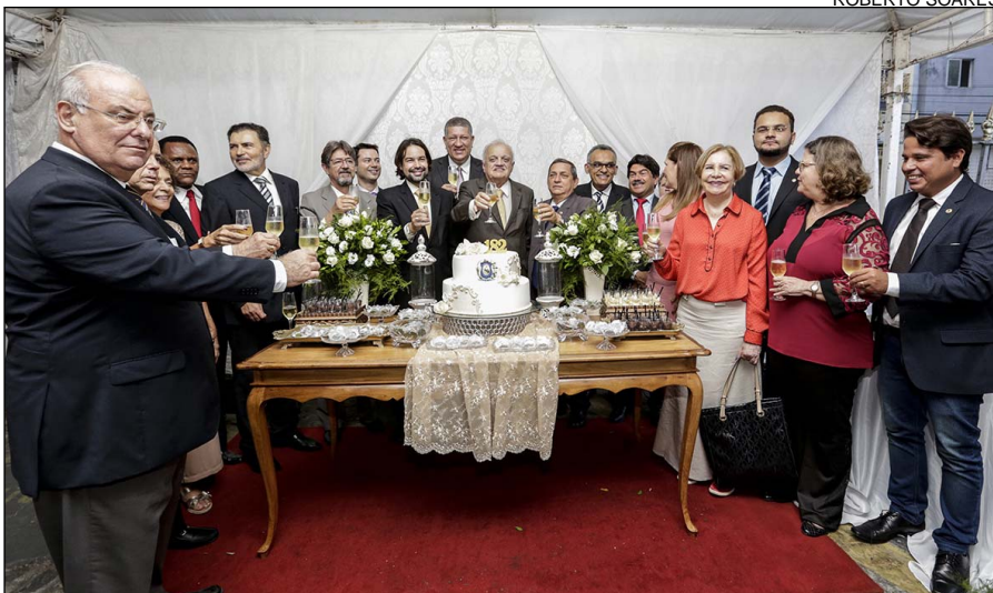
Parlamentares cantaram Parabéns a Você e brindaram. Em seguida, as deputadas presentes cortaram o bolo de aniversário