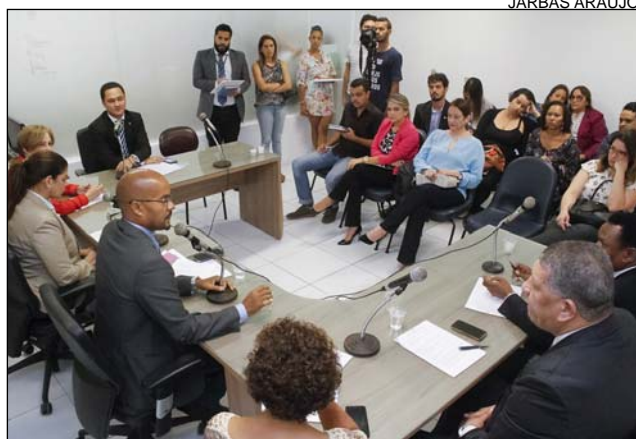
SUGESTÃO - Movimento Pernambuco de Paz propôs o debate

A segurança pública entrou em pauta a partir de pedido feito pelo Movimento Pernambuco de Paz. A enti-