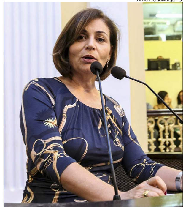
TRIBUNA - “Parabenizamos a prefeita eleita”