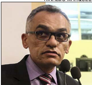
APELO - Mais segurança