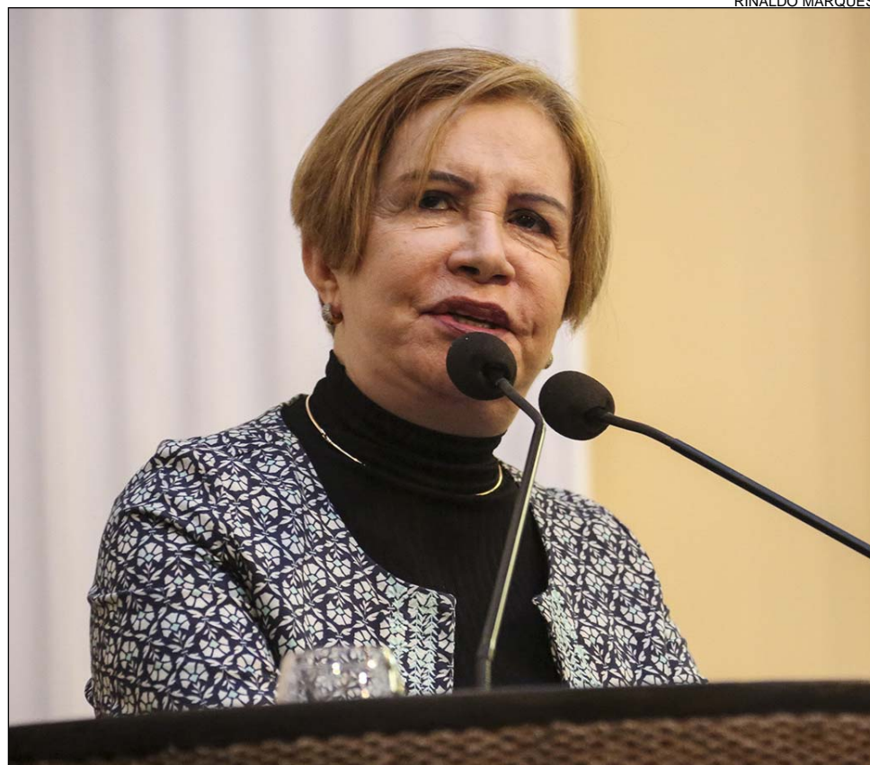
APELO - Deputada defendeu mais direitos e pediu a implementação de políticas públicas

A tucana propôs redução da jornada de trabalho para servidoras públicas estaduais que sejam mães de autistas. Ela também registrou reivindicação das famílias para a implantação, em Pernambuco, de um centro de diagnóstico para autismo, síndrome de Down e doenças raras. “É preciso