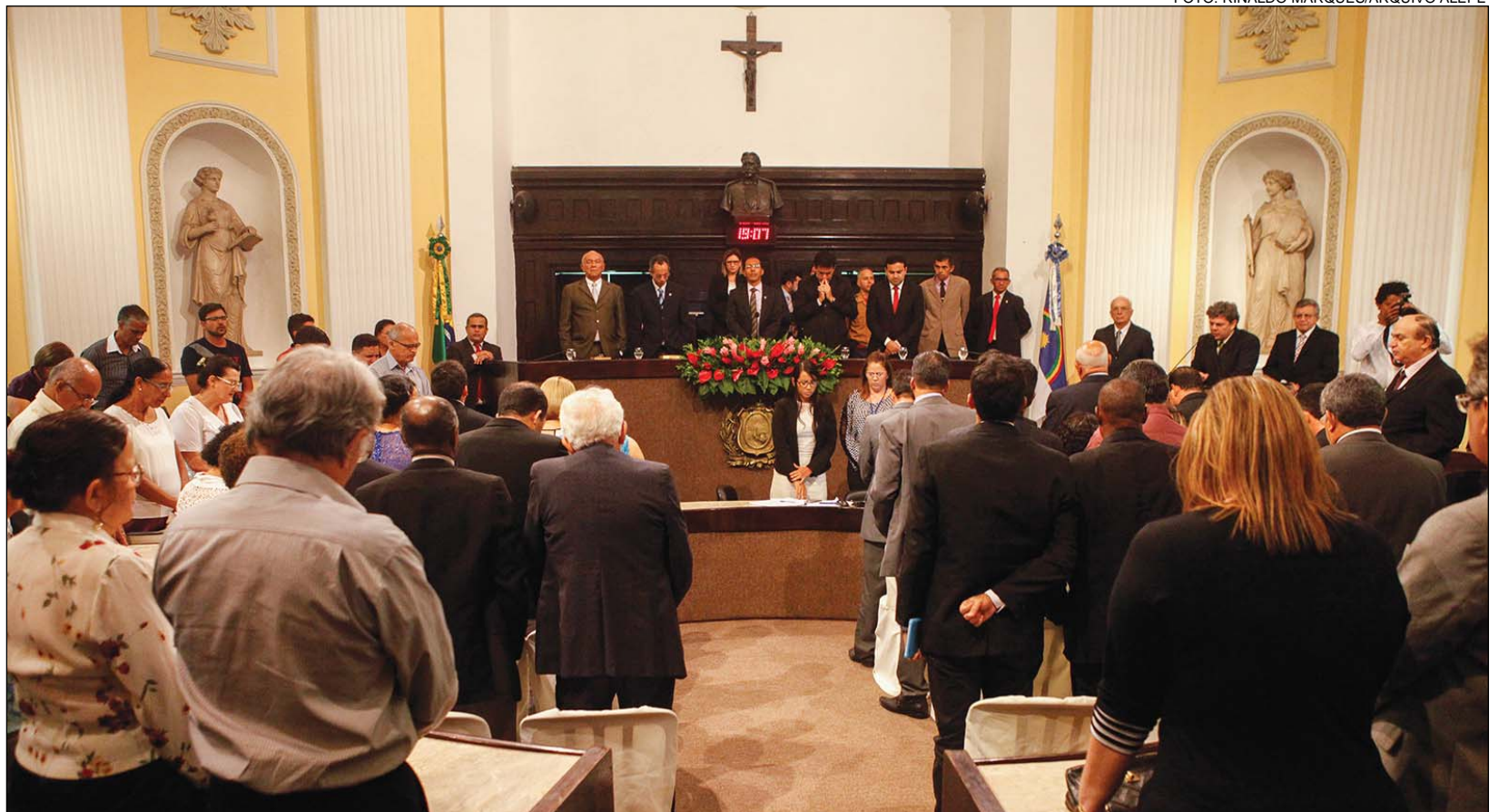
PARTICIPAÇÃO - Na Assembleia Legislativa de Pernambuco, oito dos 49 deputados estaduais se declaram evangélicos