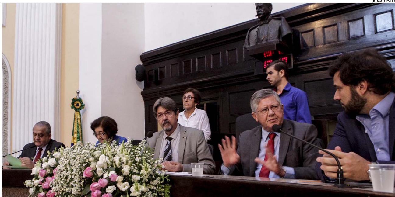
TRÂMITE - Pela manhã, projeto de lei foi debatido e aprovado na Comissão de Administração Pública

Uma das adequações atinge a regra para a avaliação de desempenho dos profissionais. Inicialmente, a proposta do Executivo vedava a permanência no regime de dedicação exclusiva ao docente ausente ou considerado inapto em uma avaliação anual. Já a nova redação prevê pelo menos duas reprovações consecutivas para impedir que o professor continue no regime.