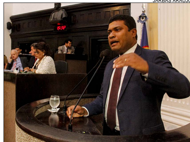
COBRANÇA - “O Governo precisa antecipar a negociação”

(PSB), disse que o Estado vem conversando sem excluir nenhuma das partes. “O diálogo já foi antecipado de abril para janeiro, e chegaremos aonde se puder chegar dentro do quadro de dificuldade que o Estado enfrenta, e o Exército nas ruas protege a sociedade”, salientou.