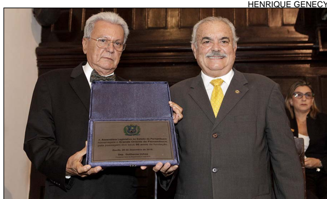
HENRIQUE GENECY COMEMORAÇÃO - Entidade completou 90 anos este mês

A partir de uma solicitação do presidente da Casa, deputado Guilherme Uchoa (PDT), a Assembleia registrou, ontem, a passagem dos 90 anos da instituição maçônica Grande Oriente de Pernambuco. O grupo foi fundado com a união de 15 lojas maçônicas que decidiram pela independência frente ao Grande Oriente do Brasil. Atualmente, a iniciativa está sob a liderança do